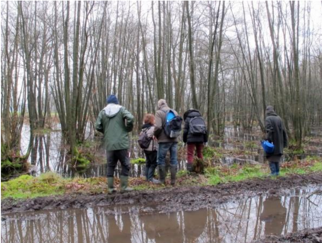
Laarzen waren hier duidelijk geen luxe!